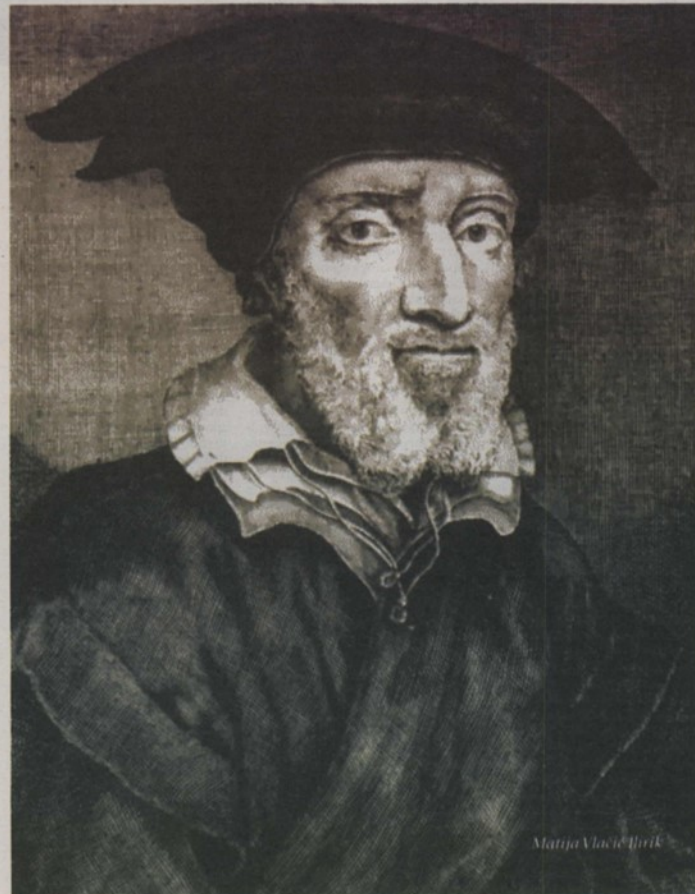
Matija Vlačić Ilirik

Nakon što je Wittenberg morao položiti oružje pred vojskom Karla V. (1547.), vladara Svetog rimskog carstva, Vlačić je, kako bi sačuvao živu glavu, morao pobjeći, ali se u jesen iste godine, kada su se političke prilike i tenzije malo smirile, vratio u grad kako bi nastavio s profesurom na sveučilištu. Međutim, kad je na državnom saboru u Augsburgu bio proglašen tzv. interim (po kojem se do konačne odluke crkvenog koncila svećenima dopuštala ženidba i kalež, ali uz uvjet priznanja papinskog primata), Vlačić nezadovoljan trulim kompromisima dijela pristaša reformacije, odlučio je otići u Magdeburg kako bi tamo mogao tiskati svoje, kasnije uplívno i značajno djelo «De vocabulo fidei» («O riječi vjere»), koje je 1550. Primož Trubar preveo na slovenski jezik, a kasnije ova je knjiga bila prevedena i na hrvatski. Prije toga, Vlačić je objavio