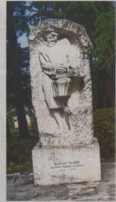
Spomenik u Labinu

U svojoj «Povijesti hrvatske protestantske književnosti u reformaciji» (Zagreb, 1910.), dr. Franjo Bučar je zapisao da je Matija Vlačić Ilirik rođen 3. ožujka 1520. u Labinu, u uglednoj plemenitaškoj obitelji Vlačić-Frančhovich, a već sa 6 godina obitelj ga je poslala na školovanje u Veneciju gdje mu je jedan od učitelja bio i glasoviti Egnatije (Giambattista Aegnatius), kasnije i sam (1550.) osumnjičen za simpatiziranje protestantizma. Matija je od njega stekao znanje latinskog, grčkog i hebrejskog, ali je upoznao i glagoljsko i ćirilčno pismo, koje je kasnije smatrao bitnim za prevođenje Biblije na hrvatski, odnosno ilirski jezik. Kada mu je bilo 17 godina, pod utjecajem svog ujaka i franjevačkog provincijala Balde Lupetina odlučio se zarediti u Bologni, ali on ga je, otvoren za nove ideje i reformu Crkve savjetovao da nastavi školovanje u Njemačkoj u kojoj je u to vrijeme na duhovnom i teološkom planu vrlo i uopće intenzivno su se osjećale i manifestirale nove duhovne tendencije. Interesantno